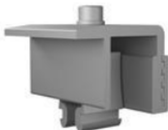
Figura 08: Grampo de fixação final (imagem ilustrativa)