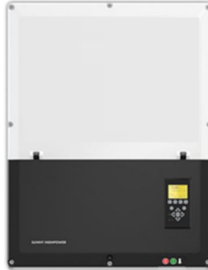
Figura 05: Inversor (imagem ilustrativa)

Preferencialmente deve seguir as seguintes características: