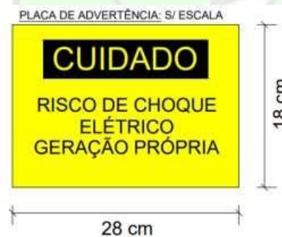
Figura 12: Placa de advertencia (imagem ilustrativa)

Será instalada uma placa de advertência, confeccionada em aço inoxidável ou alumínio anodizado, sendo afixada de forma permanente sobre a caixa de medição/proteção no padrão de entrada, com os seguintes dizeres: “CUIDADO: RISCO DE CHOQUE ELÉTRICO – GERAÇÃO PRÓPRIA”, com gravação indelével, conforme foto abaixo: