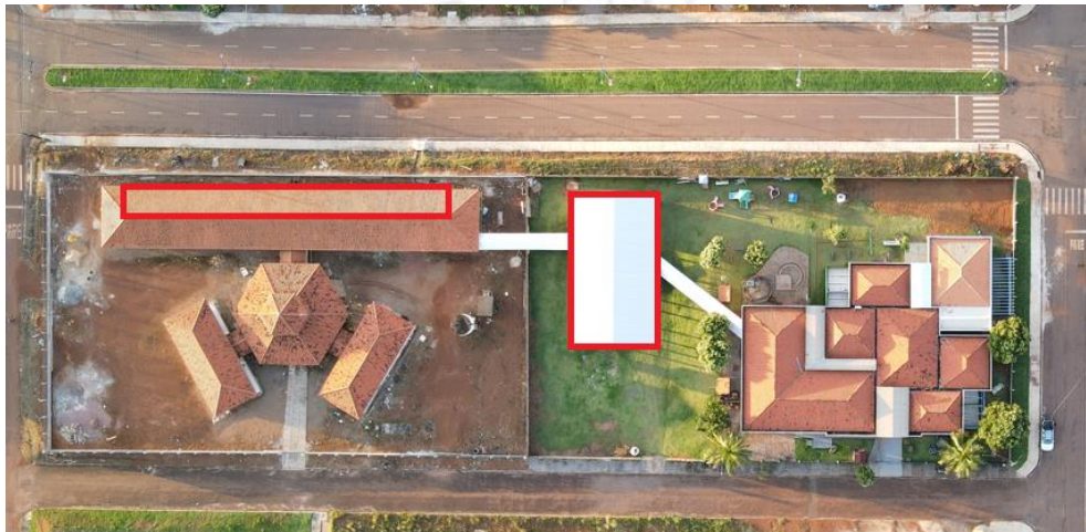
Figura 01: Planta de Situação

O Presente memorial descreve as diretrizes básicas e mínimas que devem ser observadas na execução da obra de implantação de Geração Distribuída ao Sistema de Distribuição Secundário de Energia Elétrica da Concessionária ENERGISA/MT, por meio de microgeração distribuída através da conversão solar fotovoltaica para atender as necessidades de consumo da Prefeitura Municipal de Itaúba/MT, observando as condições gerais de projeto especificação de materiais qualificação técnica mínima, localização da obra, material que deverá ser utilizado, informações para execução da obra, registro junto ao CREA/MT, aprovação junto a ENERGISA, memorial descritivo e segurança a terceiros.