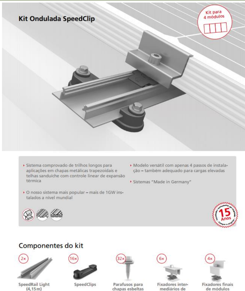
Figura 05: Detalhes de montagens (imagem ilustrativa)