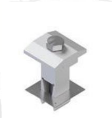
Figura 09: Grampo de fixação intermediário (imagem ilustrativa)