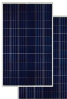
Figura 03: Módulos Fotovoltaicos (imagem ilustrativa)

É constituído de células de silício policristalinos, possui robustas esquadrias de alumínio resistente à corrosão e independentemente testado para suportar altas cargas de vento e cargas de neve. Apresenta elevada eficiência e classificação “A” pelo INMETRO.