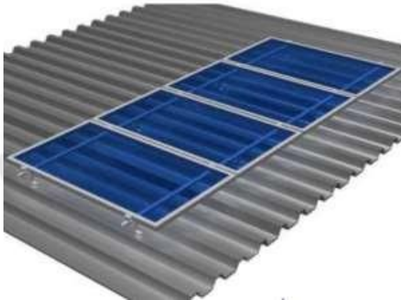
Figura 04: Estrutura carport (imagem ilustrativa)

Vale ressaltar que os sistemas de fixação da estrutura deverão resistir a rajadas de vento com velocidade de até 120 km/h.