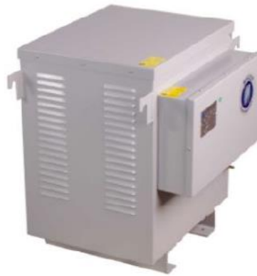
Figura 06: Autotransformador (imagem ilustrativa)

Uma característica do transformador isolador trifásico é a baixa perda e alto rendimento.